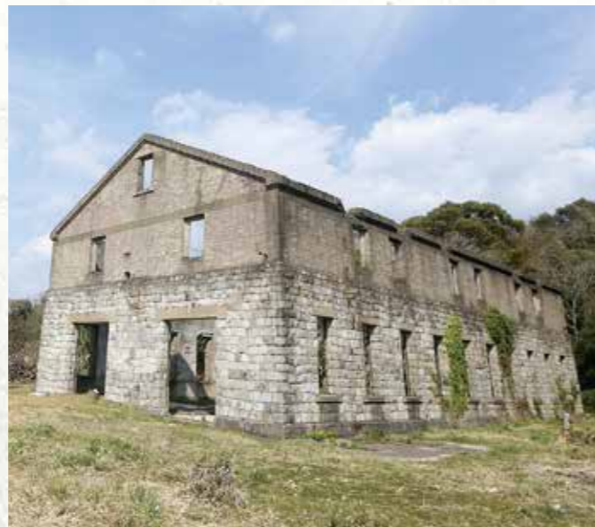
魚雷発射試験場本部跡