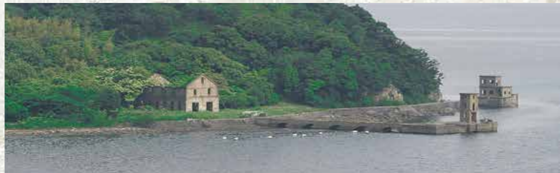
魚雷発射試験場跡→