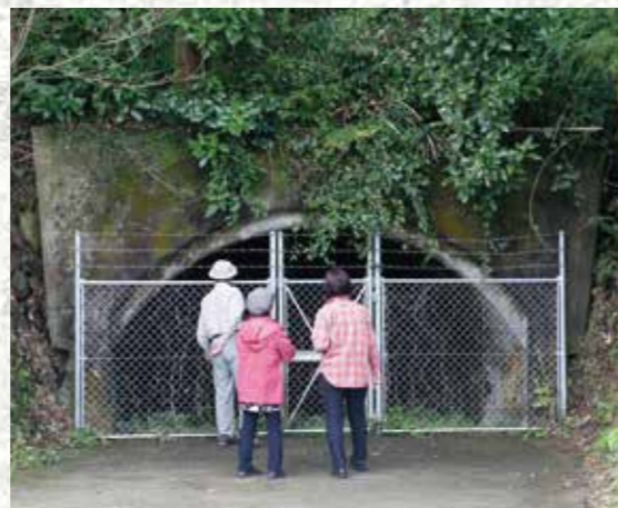
地図:⑦ 川棚海軍疎開工廠トンネル工場跡(石木郷)

日々、悪化する太平洋戦争の戦局を挽回するため魚雷艇の訓練所として1944年横須賀から移転開設されましたが、その年の9月頃より、特攻艇(震洋)要員の養成を始め、回天(魚雷)、伏龍(機雷)、蛟竜(小型潜水艇)などの要員養成にも力を入れていました。そして、この海で全国から志願した数万人の若者が日々訓練を受け、出陣し、3511名が死亡。ここにある特攻殉国の碑は、その殉国者全員の氏名が刻銘されています。