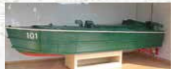
特攻艇(震洋)の模型を展示