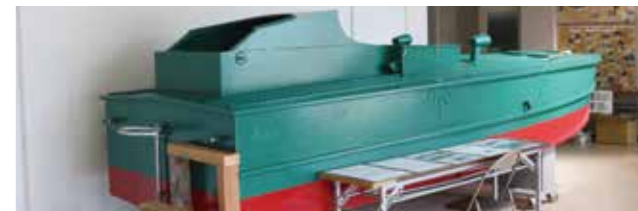
実寸大の特攻艇(震洋)の模型を展示