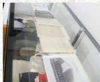
隣接する資料館には資料を展示