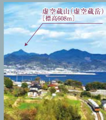
虚空蔵山(虚空蔵岳) [標高608m]

ここ片島が魚雷発射試験場に選ばれた理由は、佐世保に近かったことありますが、波が比較的、穏やかだったことや海が深かったことが大きな理由と言われています。